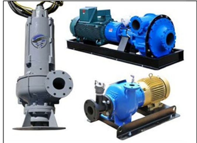
*Imagen de Despliegue Típico. Las bombas de Dragado pueden ser desplegadas horizontalmente o verticalmente. Fotos referenciales. Contáctenos para más información.